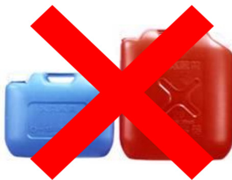
ガソリンの貯蔵に適さない容器の例 (樹脂製容器は火災危険性が高い)